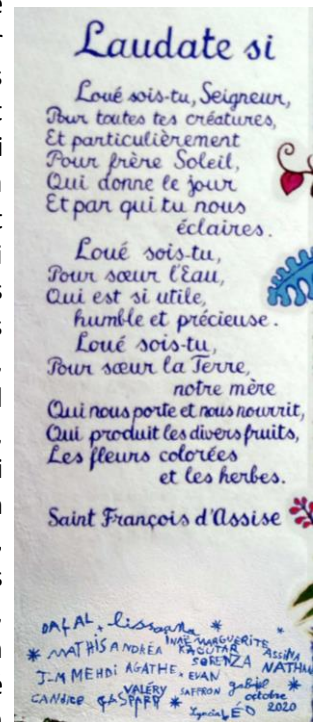
Prière apposée à la fresque, avec la signature de tous les artistes