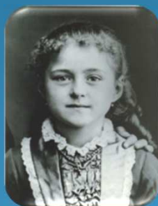
Ste Thérèse La protectrice