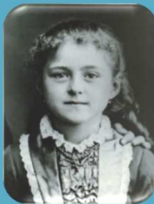
Ste Thérèse La protectrice