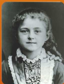
Ste Thérèse La protectrice